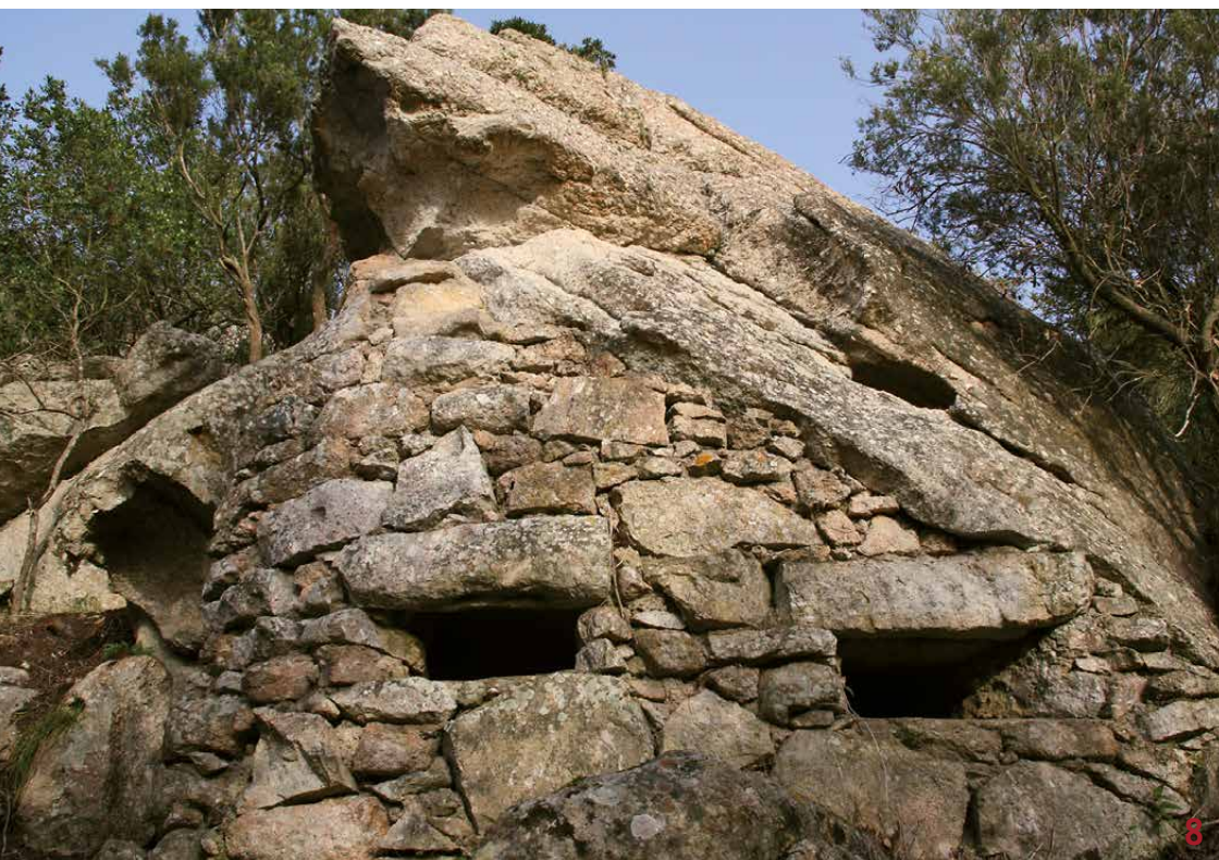
7-8 Il rifugio sottoroccia di età protostorica trasformato in casa-matta durante la seconda guerra mondiale, facente parte del grande complesso fortificato del caposaldo "Tivoli", del Monte Cocchero, Campo nell'Elba